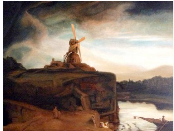
"Die Mühle" | 80x100cm | Öl auf Leinwand nach Rembrandt