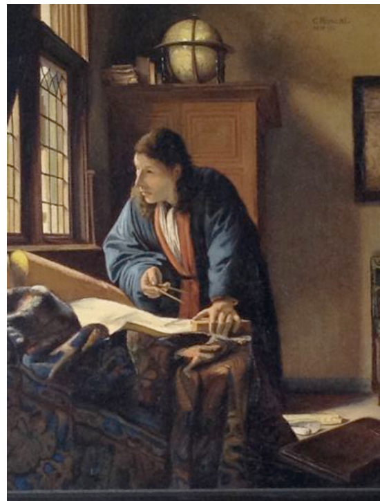
"Der Geograph" | 47x52cm | Öl auf Leinwand nach Vermeer gemalt im Städelmuseum Frankfurt am Main