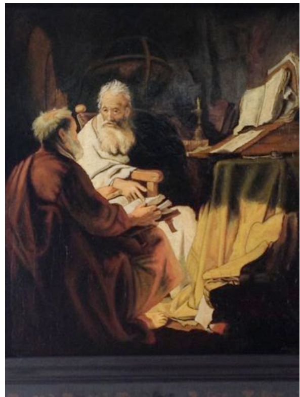
"Petrus und Paulus im Gespräch" | 50x55cm | Öl auf Tafel nach Rembrandt