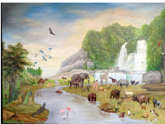
"Garten Eden" | 60x80cm | Öl auf Leinwand