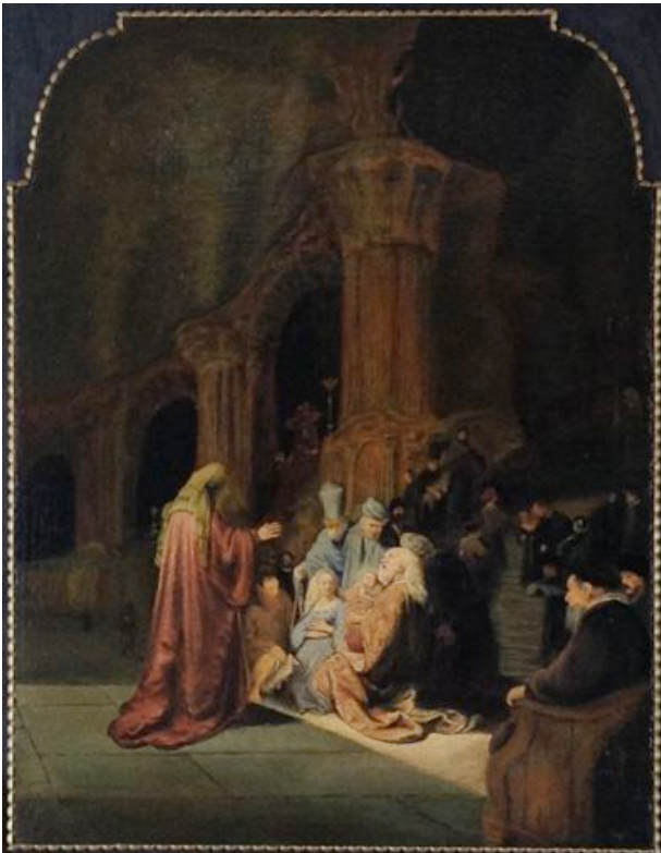
"Lobpreis Simeons" | 39x50cm | Öl auf Tafel nach Rembrandt