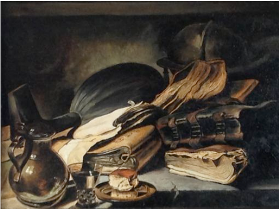
"Alte Bücher" | 31x41cm | Öl auf Tafel nach Rembrandt