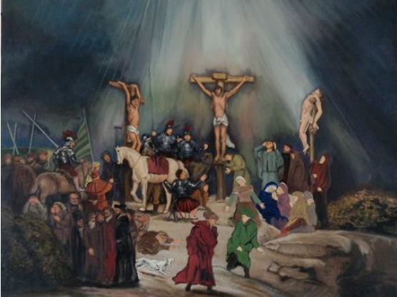
"Die Kreuzigung" | 75x89cm | Öl auf Tafel | in Bearbeitung