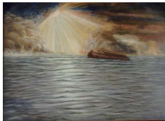
"Die Sintflut" | 60x80cm | Öl auf Leinwand