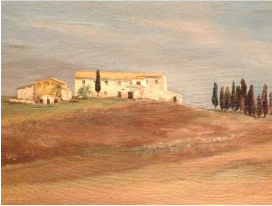
"Haus in der Toscana" | 21x40 cm | Öl auf Holz