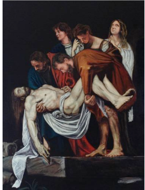
"Grablegung Christi mit der Familie des Künstlers" | 70x80cm | Öl auf Leinwand