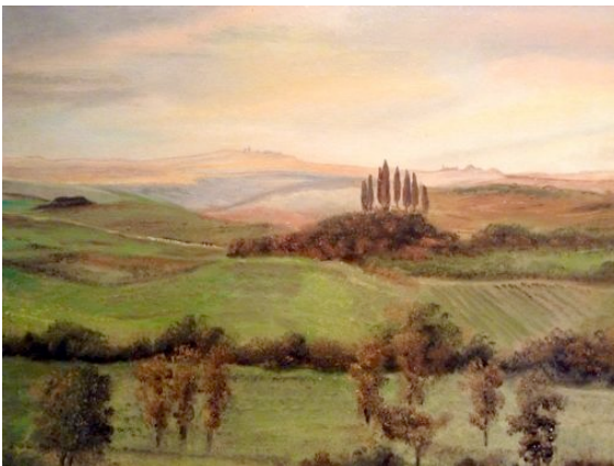
"Landschaft in der Toscana" | 24x30cm | Öl auf Leinwand