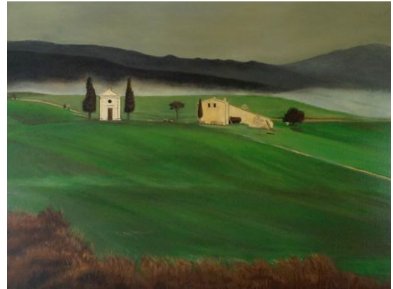
"Kapelle in der Toscana" | 80x120cm | Öl auf Leinwand