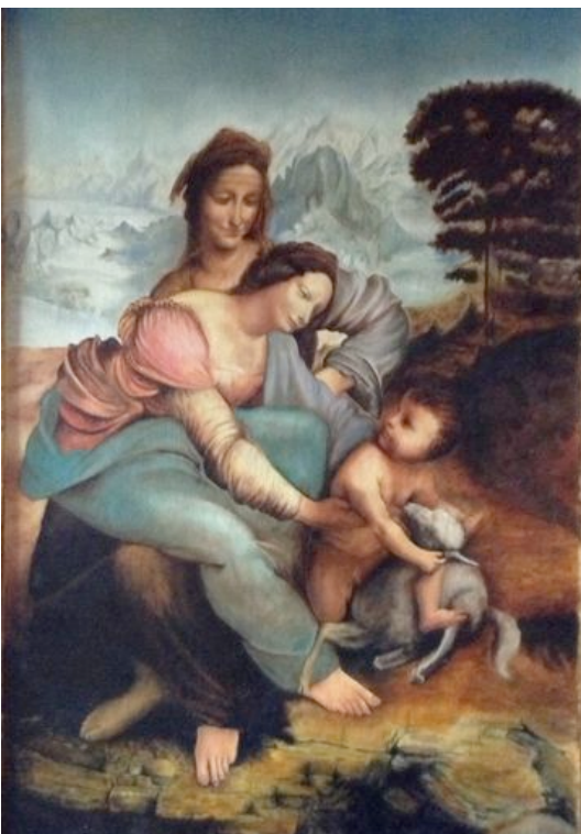
"Heilige Ana die Jungfrau und das Kind" | 50x75cm Öl auf Leinwand | nach Leonardo da Vinci